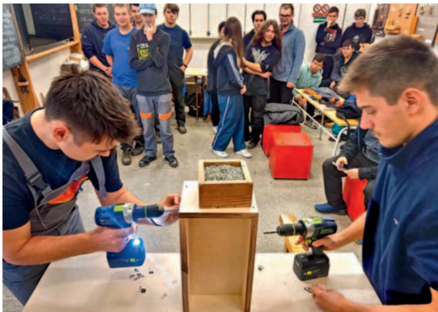
Truhláři si vyzkoušeli plnění nejrůznějších problémů. Mistři pro ně připravili projektový den.

Ani poslední měsíc v roce nechyběly na naší škole zajímavé akce.