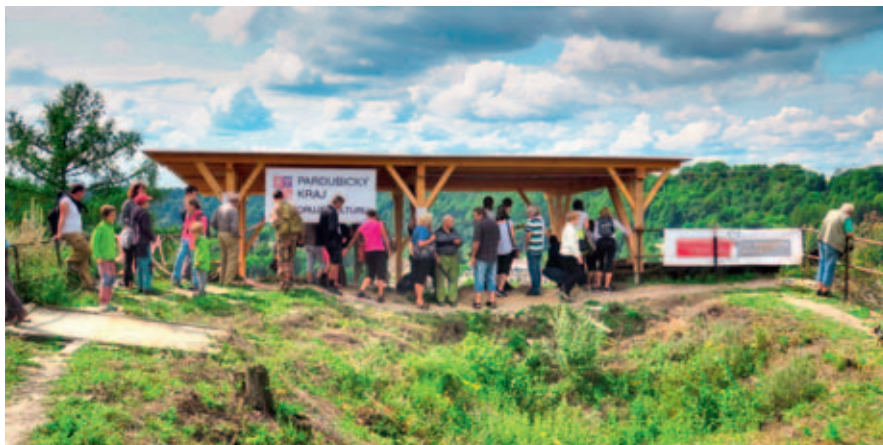
Den otevřených dveří na zřícenině hradu Brandýs nad Orlicí, 2017.

Čtvrtek 27. 2. od 18.00, Šemberův dům ARCHEOLOGIE VE VYSOKÉM MÝTĚ: OHLÉDNUTÍ PO 20 LETECH Přednáška.