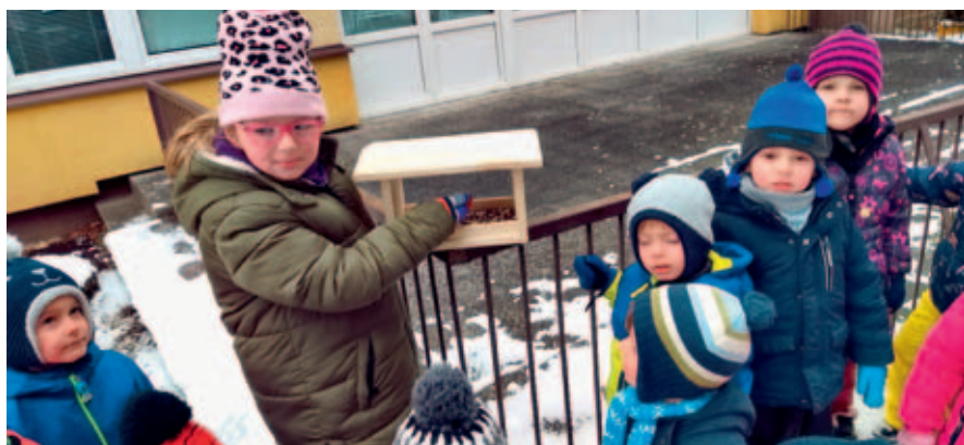
Studenti stavební školy vyrobili pro MŠ Slunečná ptačí krmítka do školní zahrady.