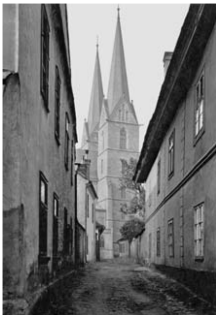
Andělská ulička, foto Josef Králík, asi 1920, sbírka RMVM.

Nová výstava s titulem Vysokomýtský uličník je ochutnávkou pro případné čtenáře připravované publikace se stejným názvem.