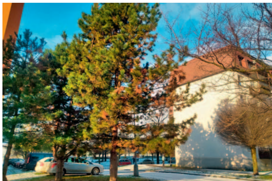
V následujících měsících dojde k vykácení nemocných jehličnanů na území města.