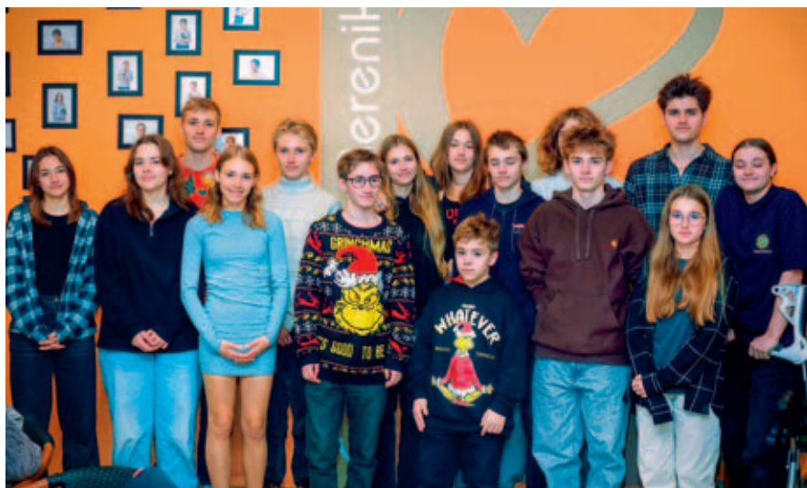
Skupina mladých dobrovolníků zapojených do projektu Srdce generací.

H: V 19.00 se otevrou dveře M-klubu. Začínáme na Klubové scéně. Hosté se mohou těšit na výstavu a projekci Srdce generací, která zachycuje segmenty tohoto mezigeneračního projektu. V 19.45 se již každý bude moci usadit na místo ve velkém sále, kde začne hlavní část galavečera. Na diváky čeká mimo jiné celkem 5 přehlídek tema-