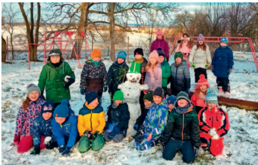
Děti se radovaly ze sněhové nadílky.

Hned od prvních dnů nového roku jsme si užívali sněhovou nadílku.