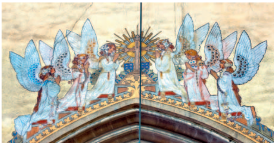
Nástěnná malba Karla Vítězslava Maška v kostele sv. Vavřince.

Papež František vyhlásil rok 2025 Jubilejním svatým rokem. Tímto nás zve, abychom znovu objevili a prohlubovali ctnost NADĚJE jako dar od Boha a naučili se ji rozvíjet.