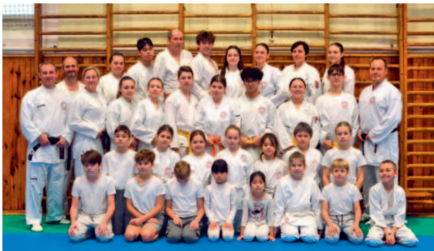
Oddíl Karate Vysoké Mýto a oddíl Bojové Sporty VM.

Oddíl Karate Vysoké Mýto a oddíl Bojové Sporty Vysoké Mýto uspořádal 12. až 14. prosince tradiční vánoční župní přebor karate východočeské župy Pippichovi – Christmas Cup Karate Vysoké Mýto 2024.