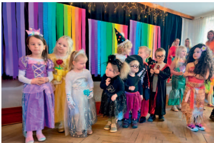
Karneval byl plný hudby, tance a soutěží.