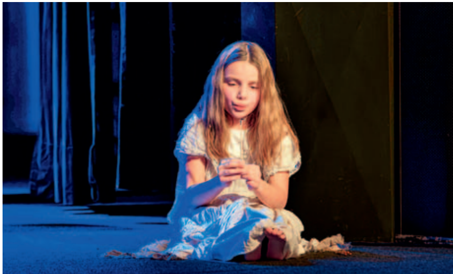
Tanečně ztvárněný Andersenův příběh Děvčátko se sirkami.

V pondělí 13. ledna proběhla v M-klubu premiéra představení Děvčátko se sirkami.