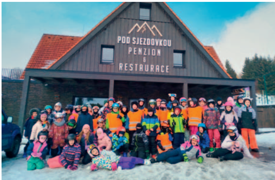
Příměstské lyžařské tábory pro žáky 1. stupně.

Opět po roce se první stupeň vrací na svahy lyžařského střediska Čenkovice.