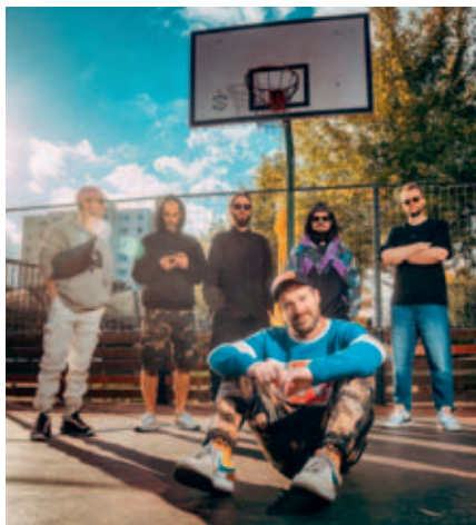
Pražská hip hopová skupina působí už od roku 2002.

Pražská hip hopová kapela Prago Union funguje více než dvacet let. Frontman skupiny Kato působí na hudební scéně od