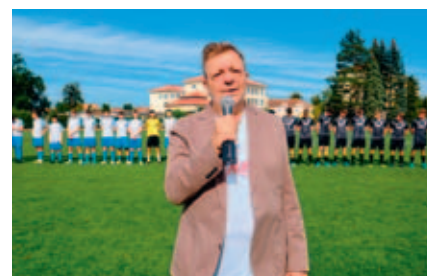
Holka od vedle