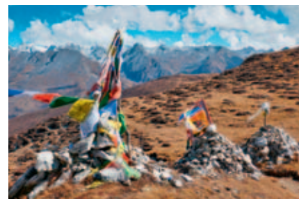
Bhútán nabízí krásnou přírodu i místní tradice.