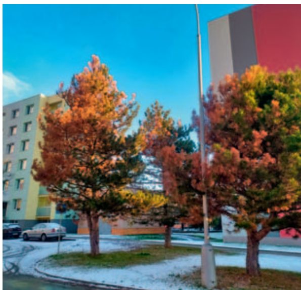
Kácení smrků a borovic.

Dalšími napadenými stromy jsou smrky. Smrky jsou poškozovány mšičí smrkovou ( Elatobium abietinum ), která způsobuje postupné opadání jehlic. Nárůst teplot v zimním období může vést k vyšším populacím mšič v jarním období. Mšiče se v jarním období velmi rychle množí, a to obzvláště tehdy, je-li sucho. Významný vliv na usychání smrků dále mají abiotické faktory. Smrky nejsou schopné odolávat a aklimati-