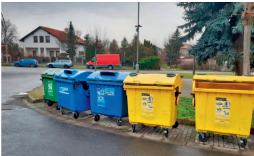
Sběrné místo.

Město Vysoké Mýto pořídilo mobilní kameru, která monitoruje problematická místa ukládání odpadů.