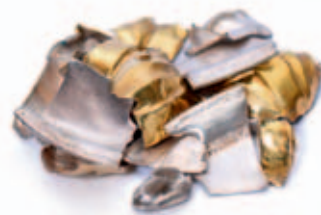
Příkladem zajímavého nálezu je i tento rozstříhaný kalich. Sběrka RMVM.

V letošním roce uplyne 20 let od chvíle, kdy Regionální muzeum ve Vysokém Mýtě získalo oprávnění provádět archeologické výzkumy. Při této příležitosti muzeum připravilo malou prezentaci několika zajímavých, významných či raritních předmětů pocházejících ze zmíněné dvacetileté archeologické činnosti. Tento výběr si zájemci mohou prohlédnout zdarma ve vstupních prostorech muzea v ulici A. V. Šembery.