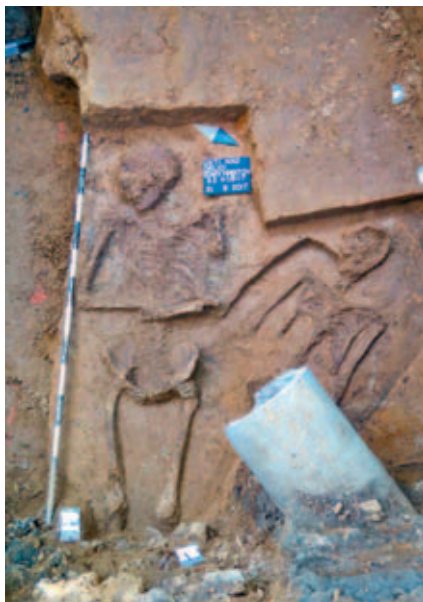
Nález hrobu při vykopávkách v Ústí nad Orlicí, 2017.