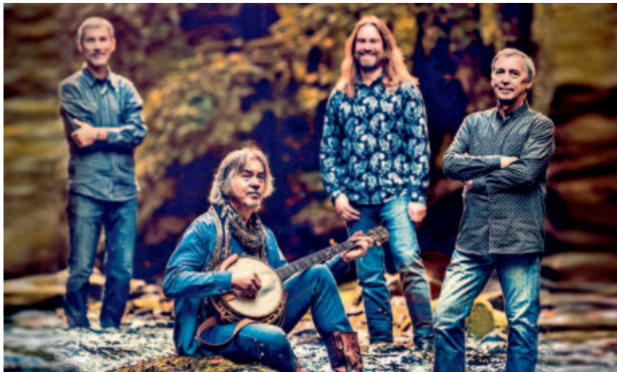
Bratři Malinové představí v M-klubu i písně z nového alba V peřejích .

Malina Brothers přivezou do Mýta nové album a oslaví 15 let.