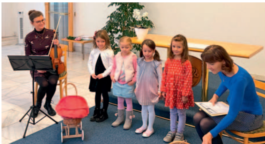
Privítání nových občánků proběhne 5. dubna.

Zveme nové občánky Vysokého Mýta a jejich blízké na vítání dětí se zápisem do pamětní knihy našeho města. Slavnostní obřad se uskuteční v sobotu 5. dubna v dopoledních hodinách v obřadní síni v budově Městského úřadu Vysoké Mýto.