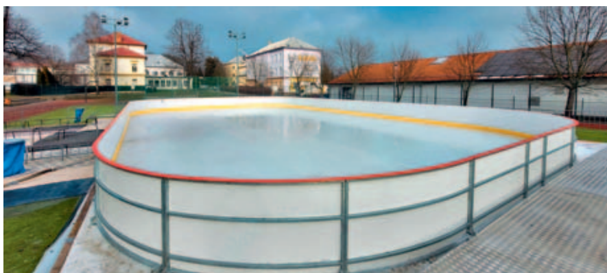
Bruslení na městském veřejném kluzišti bylo zahájeno.

Po – Pá 9.00 – 13.00, 15.00 – 20.00 (dopoledne vyhrazeno pro školy), So – Ne 10.00 – 20.00