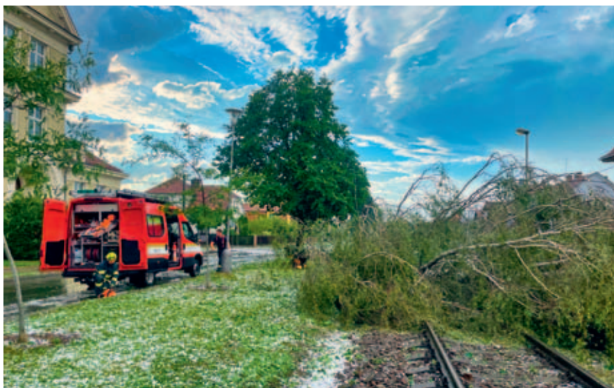
Odklizení následků po větrné bouři a krupobití v loňském červenci.

Jednotka sboru dobrovolných hasičů zřizovaná městem Vysokým Mýtem úzce spolupracuje s týmem profesionálních hasičů z vysokomýtské stanice Hasičského záchranného sboru Pardubického kraje. Vedle výjezdů k požárům a dopravním nehodám pomáhá například při povodních a dalších mimořádných událostech. „Oceňujeme činnost jednotky za její profesionalitu při zásazích a obětavou pomoc občanům při mimořádných událostech. Průběžně zlepšujeme její technickou vybavenost. Letos poříďme cisternovou automobilovou stříkačku a modernější hydraulické zařízení, které bude sloužit našim hasičům při vyprošťování osob při dopravních nehodách,“ řekl starosta František Jiraský.