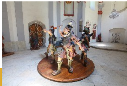
Expozice barokních plastik v kostele sv. Mikuláše ve Vraclavi