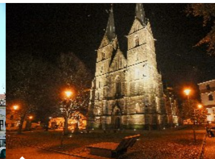
Kostel sv. Vavřince