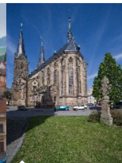
Kostel sv. Vavřince