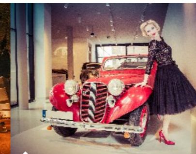
Expozice muzea českého karosářství