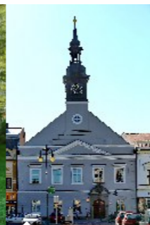
Muzeum českého karosářství