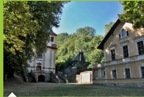
Barokní areál Vraclav