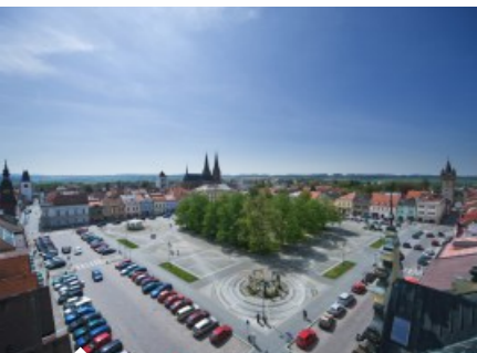
Náměstí Přemysla Otakara II.