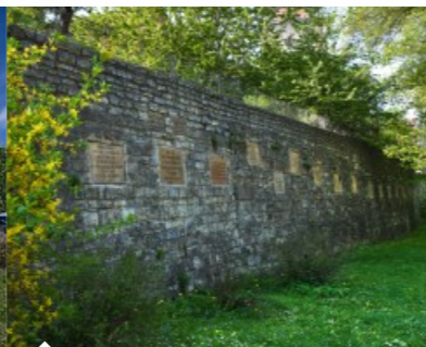
Kamenné desky v Jungmannových sadech