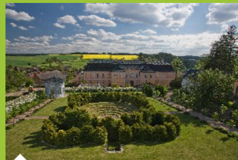
Zámek Nové Hradky